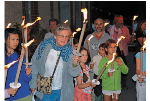
Une retraite aux flambeaux sur l'histoire de la commune.