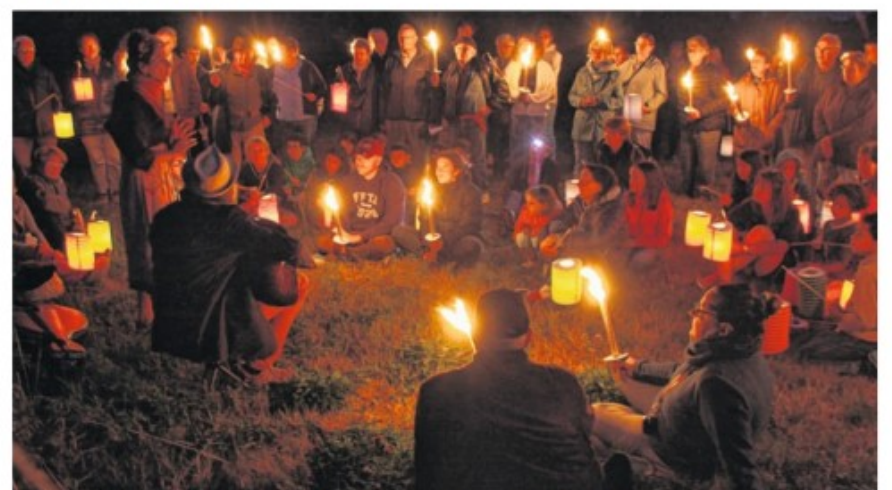
Une marche autour de la colline d'Autheuil avec la compagnie Koeko.