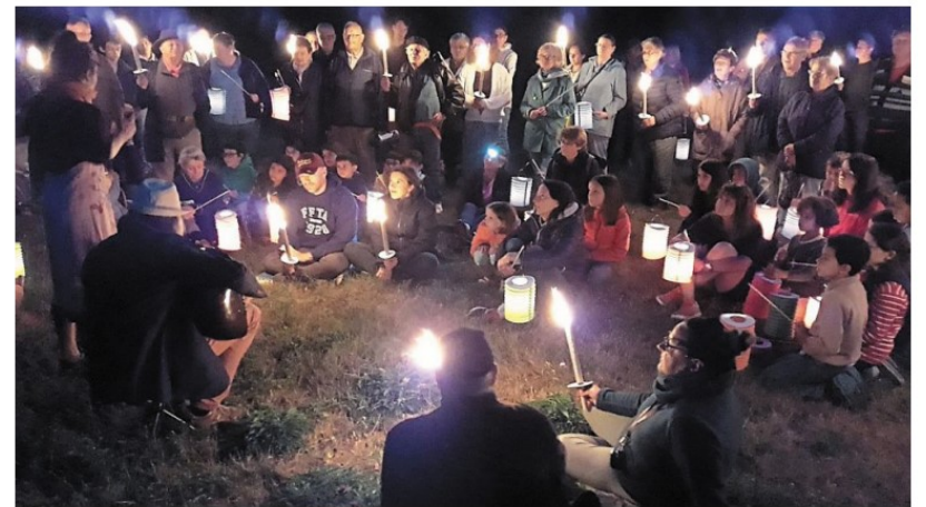
Près de 90 participants pour cette balade contée aux flambeaux.

Judi 15 août , fête patronale, 10 h 30 messe et vin d'honneur ; 12 h 30 repas sur réservation au jardin de la mairie au 02 33 25 54 47 ; 16 h visite guidée de l'église romane par E. Montagne-Borel.